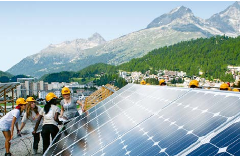
Jugendherberge St. Moritz